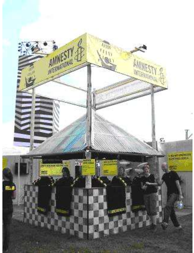
Amnesty-stand op Lowlands

The Congo Experience stond ook op popfestival Pinkpop. Daarnaast was de Congolese radiomaakster Chouchou Namegabe er te gast. Zij maakte geluidsopnamen met het publiek, die zij in de DRC kon uitzenden om het taboe dat er rust op het spreken over seksueel geweld te doorbreken.