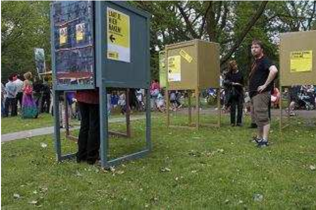
The Congo Experience