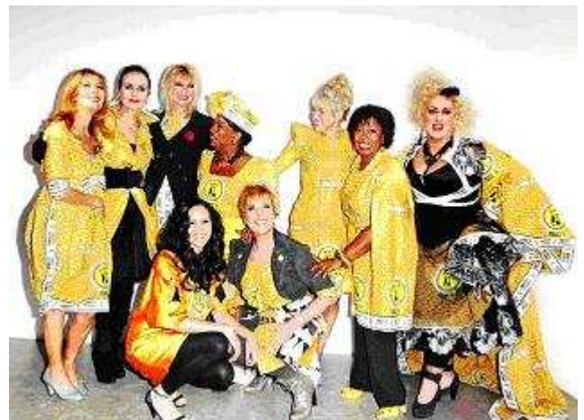
Nederlandse beroemdheden in pagne-creaties tijdens Women Inc.