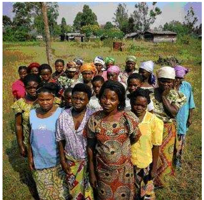
Deze foto van Robin Hammond werd het beeldmerk van de campagne. De vrouwen die erop staan zijn zo brutaal verkracht dat zij nu incontinent zijn. Hun gemeenschap heeft hen daarom verstoten. Samen hebben zij een eigen dorp gesticht, afgezonderd van de andere woongemeenschappen.

Na 8 maart richtte de campagne zich vooral op seksueel geweld in de Democratische Republiek Congo. Gewelddadige conflicten tussen de regering en rebellengroeperingen teisterden dat land al jaren. Alle strijdende partijen zetten daarbij een gruwelijk wapen in: seksueel geweld tegen vrouwen. Dagelijks treft dat geweld vele vrouwen en meisjes, op de meest gruwelijke wijze. Daders worden zelden bestraft. Wij voerden campagne onder de slogan 'Verkrachting is killing. Stop seksueel geweld als oorlogswapen.'