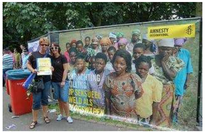
Pinkpopgangers in actie voor de campagne