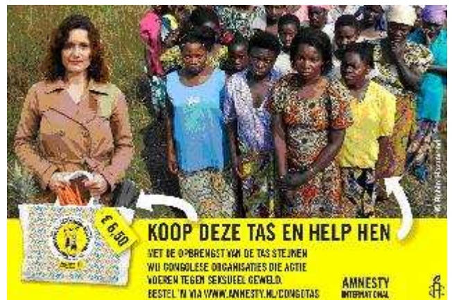
Advertentie voor de op de pagnes geïnspireerde tas