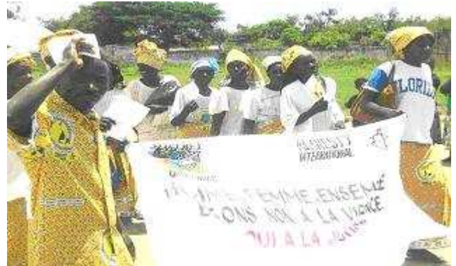
Congolezen gekleed in de pagnes brengen kaarten naar de kerken.

Ook op de pagnes geïnspireerde tassen werden ingezet om geld op te halen. Lokale groepen hebben hier enorm aan bijgedragen door ze op en rond 8 maart te verkopen. Via hen en de webshop werden er zo'n vierduizend van verkocht. De tassen waren al vrij snel uitverkocht, de opbrengst hiervan komt ten goed aan de acties van de vrouwenorganisaties in Congo.