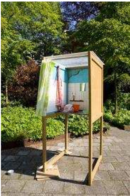
Cabine van de 'Congo-experience'