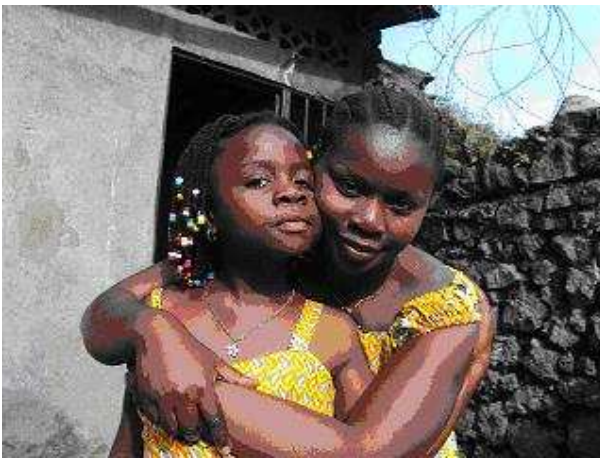
2 Congolese meisjes in jurken van stof met opdruk tegen seksueel geweld