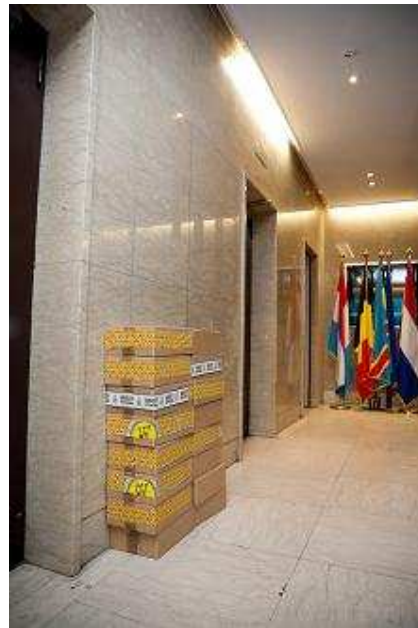
Meer dan 125.000 handtekeningen bij de Congolese ambassade